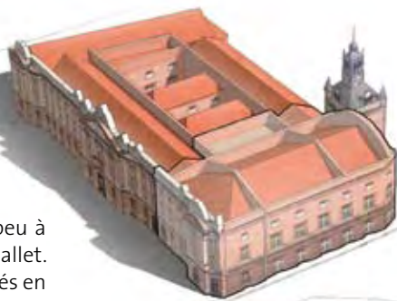
Emprise du théâtre au sein du Capitole en 1882

Il intervient au cours des représentations d'opéra ou en guise de divertissement en intermède et clôture. À la fin du XIX e siècle, les danseurs se font rares et les rôles masculins sont la plupart du temps assurés par des « danseuses travesties ».